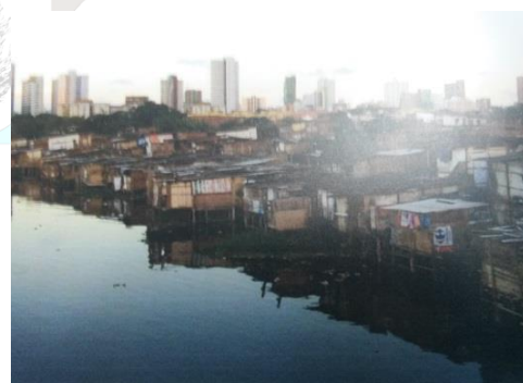
Comunidade (dias atuais)