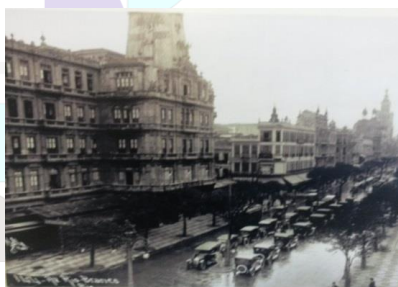
AC - Rio Branco (anos 50)