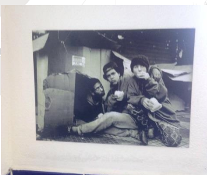
Moradores de rua (meados dos anos 2000)