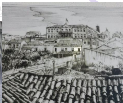
Cidade por volta da década de 60