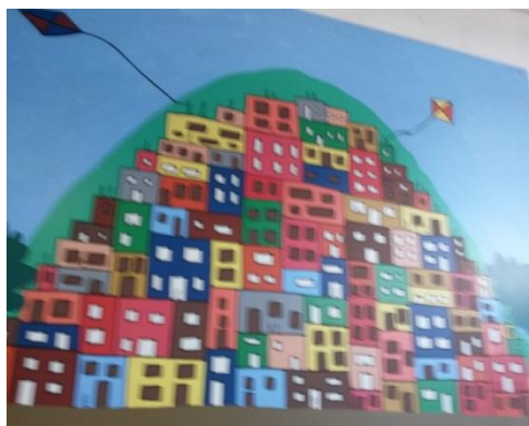
Desenho representando uma comunidade.