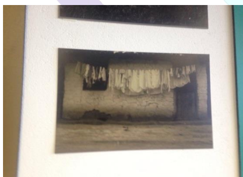
Casa de barro (anos 70)